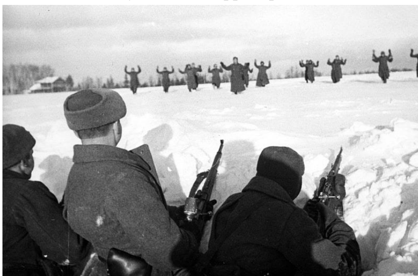
Немецкие солдаты сдаются в плен красноармейцам во время битвы за Москву

После Сталинграда последовала Курская битва, которая окончательно переломала ход Второй мировой войны. С того момента началось стремительное изгнание оккупантов с территории Советского Союза.