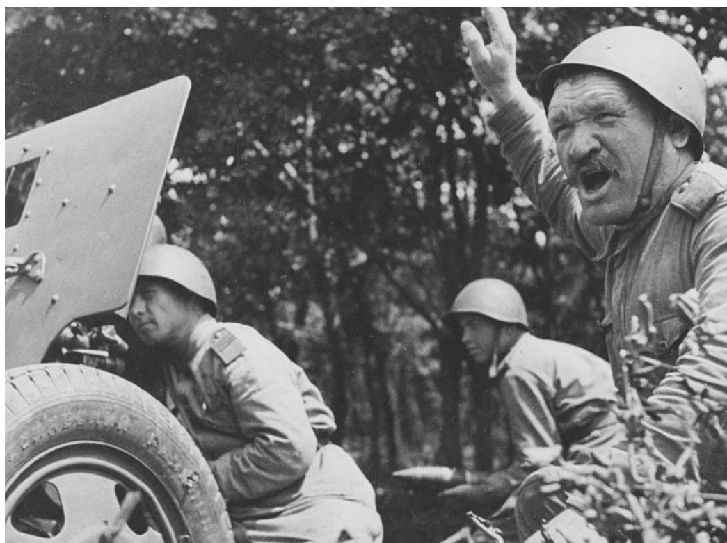
Командир советской 76-мм дивизионной пушки ЗиС-3 отдает команду расчету, 1943 г.

В период 1941-1942 гг. в Северной Африке победы одерживала то одна, то другая стороны. Параллельно с этим велись ожесточенные морские сражения, в которых важную роль играли подводные лодки.