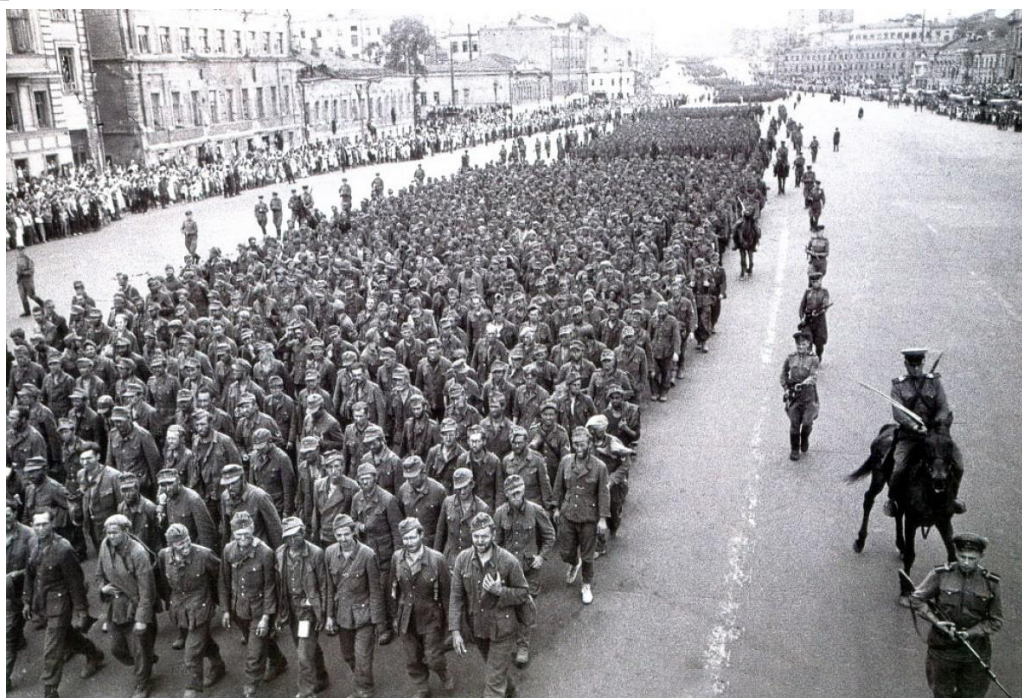
Колонна пленных немцев на Садовом кольце, Москва, 1944 г.

Советская армия совершила героический подвиг, начав активное наступление на вермахт. Основными военными операциями командовал Георгий Жуков. Именно благодаря русским войскам блицкриг был сорван.