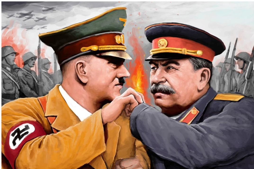
Стилизованное фото «Гитлер против Сталина»

Вскоре к данному союзу примкнули США, согласившиеся оказывать военную, продовольственную и экономическую помощь. Благодаря этому страны смогли рационально использовать собственные ресурсы и оказывать друг другу поддержку.