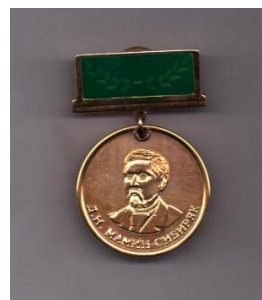
Медаль Всероссийской литературной премии имени Д.Н. Мамина-Сибиряка