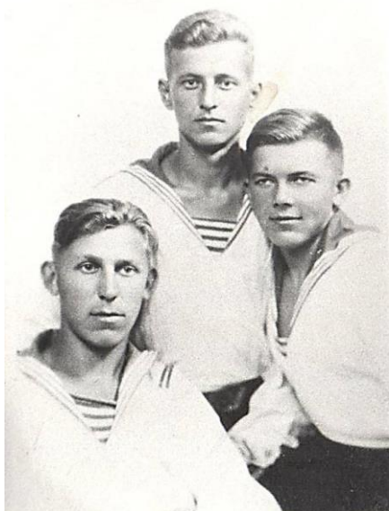
Май 1946 г.

Все материалы указателя можно найти в фондах Центральной городской библиотеки имени В. В. Волоскова, за исключением отмеченных «*».